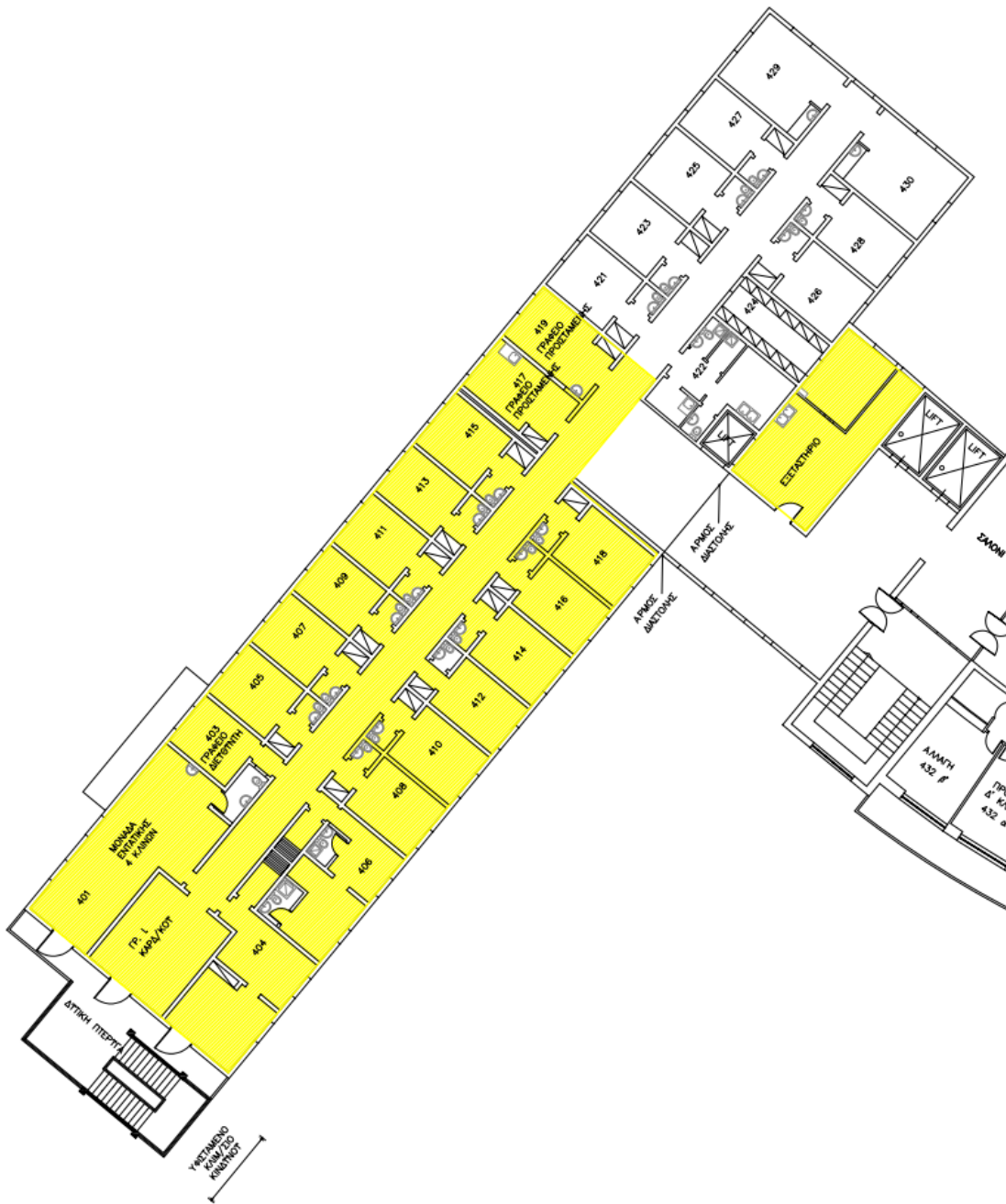
Εικόνα 4. Κάτοψη χώρων Καρδιολογικής Κλινικής στους οποίους θα πραγματοποιηθούν εργασίες ελαιοχρωματισμού